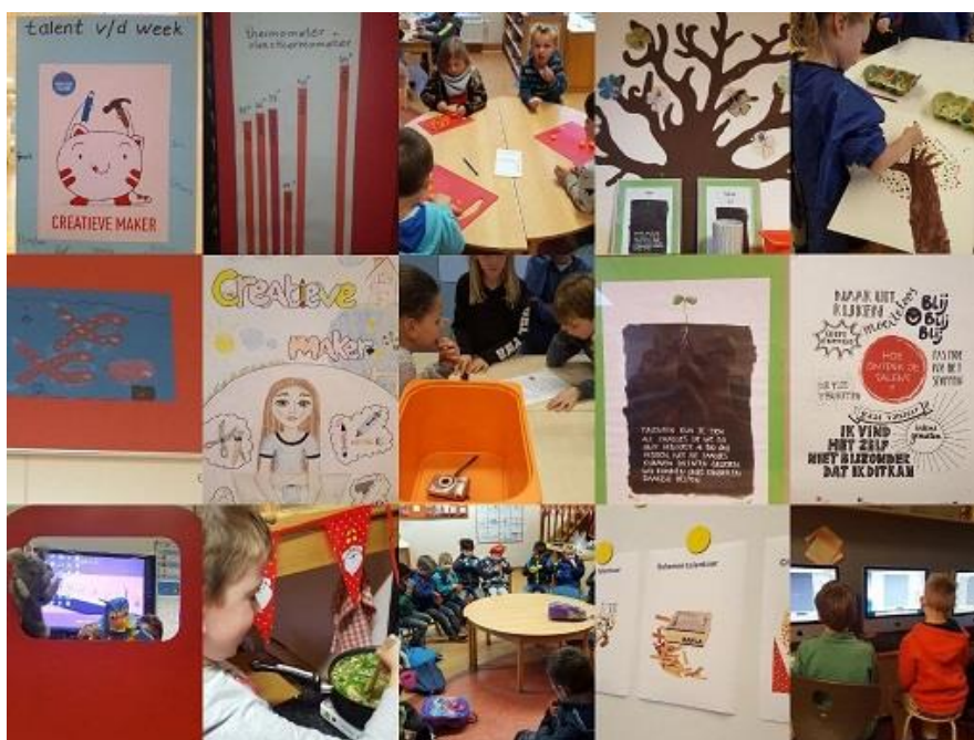
DIVERSE ACTIVITEITEN IN DE KLEUTERGROEP